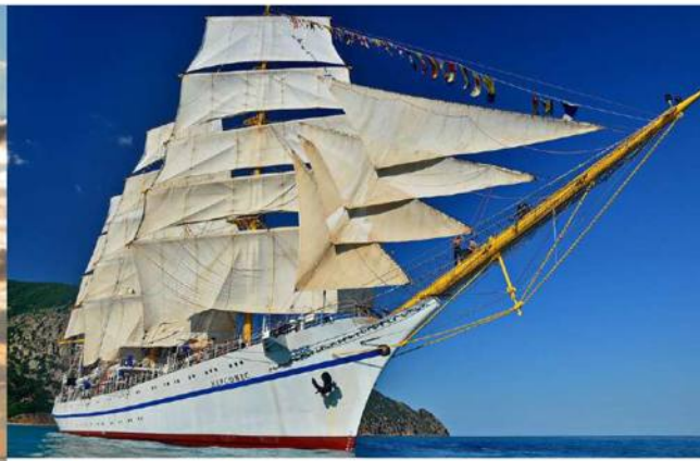
Парусное учебное судно «Херсонес»