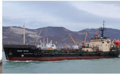
Танкер «Инженер Чертков»