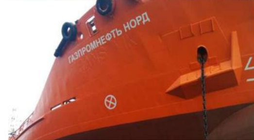
Танкер «Газпромнефть Норд»