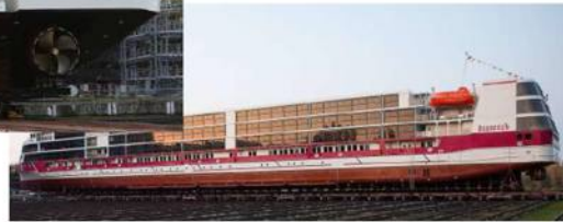
Круизный теплоход проекта PV-300 «Мустай Карим»