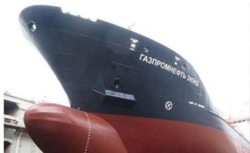
Танкер «Газпромнефть Зюйд»