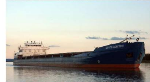
Сухогруз «Волго-Дон 5041»