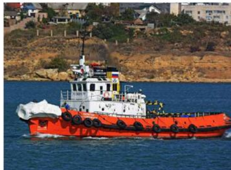
Буксир «Капитан Задорожный»