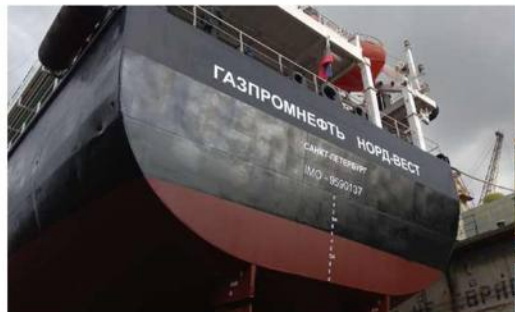
Танкер «Газпромнефть Норд-Вест»