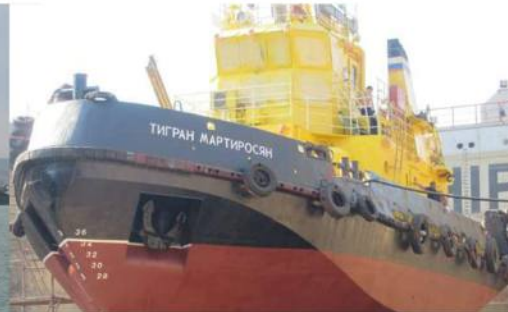
Буксир «Тигран Мартиросян»