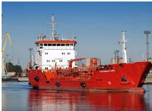
Танкер «Газпромнефть Норд»